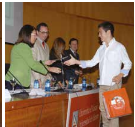
3 er clasificado.