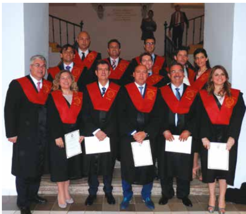
Al pie de la escalera de acceso a la Facultad, tras haber recibido la beca y el certificado acreditativo.