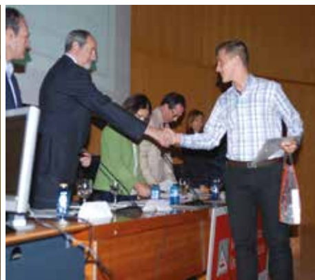
2 o clasificado.