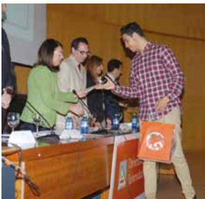
1 er clasificado.