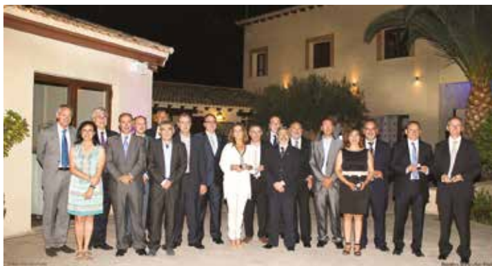
Compañeros homenajeados por sus 25 años en el Colegio.