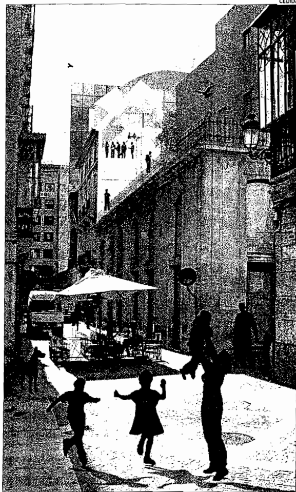
Infografía del Colegio de Economistas, que aparece con personas dentro

La oficina de concursos también declaró ganador del concurso para rehabilitar la sede del Colegio de Economistas, situada en la calle de San Isidro, del Casco Antiguo, al proyecto del estudio Noname 29 S. L., dirigido por el arquitecto alicantino Alfredo Payá Benedito titulado «Miradas o cómo hacer que un edificio se abra a su entorno». El jurado reunió el pasado 15 de mayo valoró por unanimidad «el ajustado diseño de la propuesta, la organización programática y la precisa distribución en planta». Asimismo, destacó positivamente «la resolución del patio de ilu-