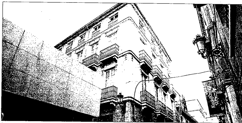
Fachada del edificio del Colegio de Economistas de Alicante, ayer.

Para esta nueva legislatura, Merargues se ha marcado una serie de objetivos que desea hacer realidad antes de cuatro años. Al frente de los nuevos proyectos se encuentra la reforma de la Sede Social de Alicante. Este cometido se encargó recientemente al Colegio de Arquitectos, a través de la firma de un Convenio por el que se presentaba a concurso la rehabilitación del edificio. En este sentido, existe una particularidad ya que el Colegio de Arquitectos ha creado una Oficina de Concursos de la Comunidad Valenciana para normalizar y potenciar su uso en este tipo de actuaciones «reformas», que ahora inaugura el proyecto de rehabilitación de la sede social de los economistas. Dicha reforma persigue el objetivo de adaptar este «blemático» edificio a las nuevas tecnologías y conseguir la máxima funcionalidad y accesibilidad al inmueble. Según Merargues, la construcción posee