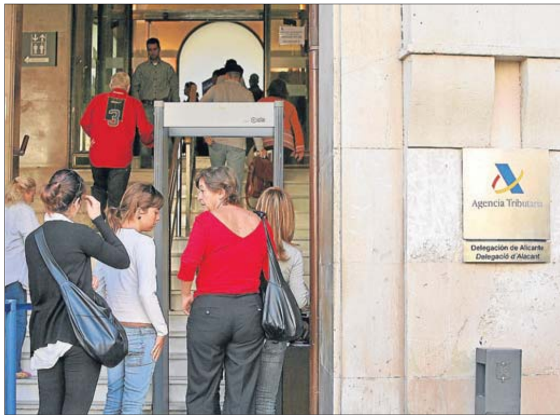
Varias personas hacen cola en la delegación de la Agencia Tributaria en Alicante.