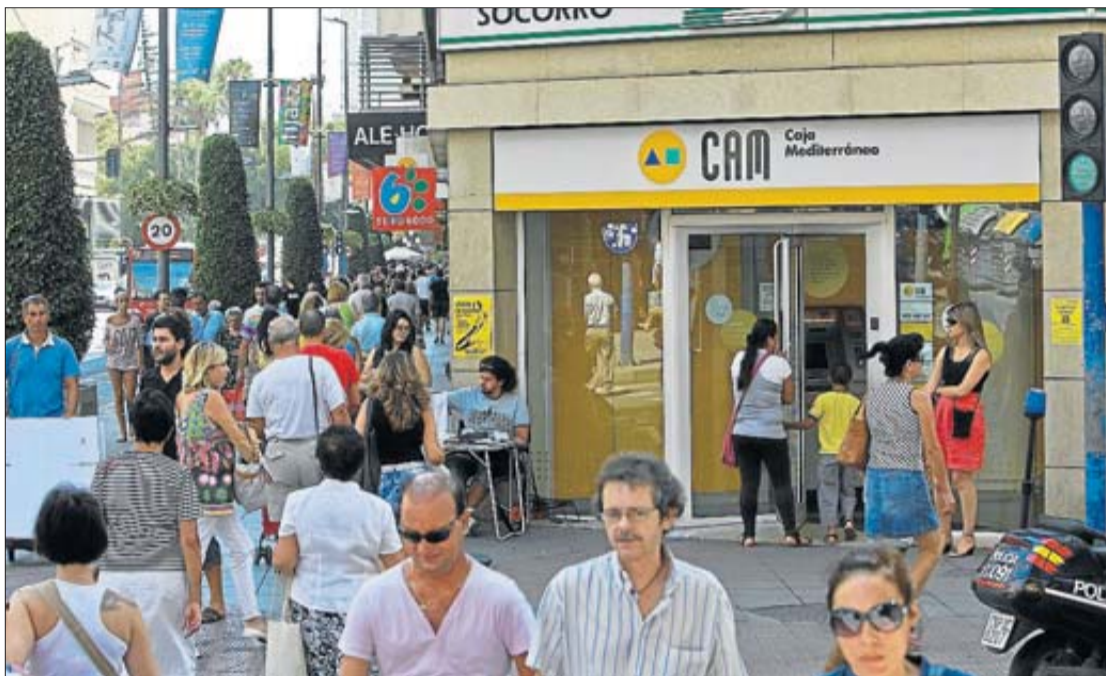
Una de las sucursales que las entidades bancarias tienen en la provincia.