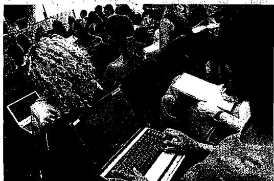
Los proyectos sobre nuevas tecnologías marcan las primeras inscripciones

Pero el proyecto también tendrá su traslación en Internet. Está previsto que las veinte exposiciones se graben y se cuelguen en la plataforma Cam-On, «de manera que cualquier empresario, sea de China o Estados Unidos, pueda ver alguna de estas presentaciones y tal vez le interese y entre en contacto con quien la ideó», señala Trigueros, quien recalca que el concurso es una iniciativa diferenciadora.